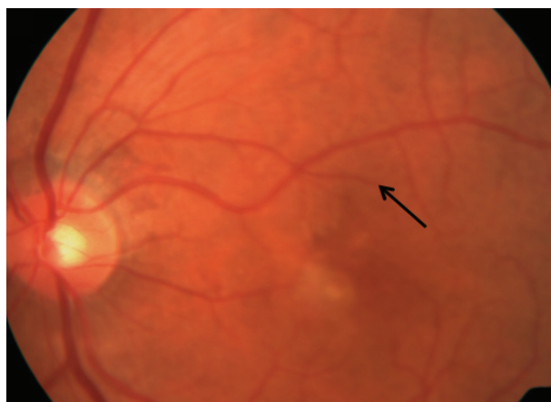
Figura 2 AMD húmeda. Neovascularización coroidea (indicada con la flecha).

En la AMD húmeda, existe una disminución repentina o gradual de la agudeza visual, puntos ciegos en el centro de la visión y distorsión de líneas rectas. El signo distintivo de la AMD húmeda es la neovascularización coroidea ( choroidal neovascularization, CNV ) ( Figura 2 ).